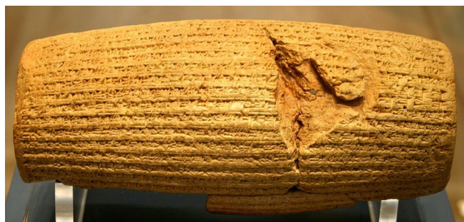
Kyros-sylinderen forteller om Kyros' erobring av Babylon og hans tilgivelse av fanger, deriblant jøder. (Det britiske museum)

Etter vanlig profetisk språkbruk går vi ut fra at disse 70 ukene symboliserer 490 år – ett år for hver dag. Vers 25 forteller at denne perioden begynte med befalingen om at Jerusalem skulle gjenreises. Dette skjedde ved slutten av jødernes fangenskap i Babylon da de persiske konger utstedte befalinger om at Guds tempel i Jerusalem skulle gjenreises (Esra kap.1;2). Perioden slutter med at Messias, Jesus, skulle komme. Tiden mellom slutten på fangenskapet og Jesu komme var omtrent 500 år. Jødene forstod dette på Jesu tid (Luk.3;15) og forventningene var store.